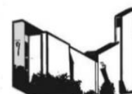
KOSTBARES BLUT BURGJOSS