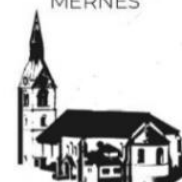
ST. MARTIN OBERNDORF