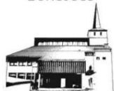
HERZ JESU PFAFFENHAUSEN

Pfarrbote auch online auf unserer Internetseite: www.katholische-kirche-jossgrund.de