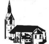
ST. MARTIN OBERNDORF