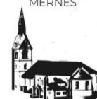
ST. MARTIN OBERNDORF