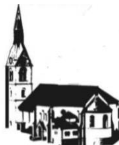
ST. MARTIN OBERNDORF