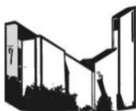
KOSTBARES BLUT BURGJOSS