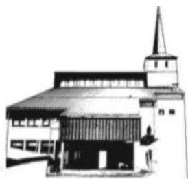
HERZ JESU PFAFFENHAUSEN

Die Kollekte ist für unsere Kirchen bestimmt.