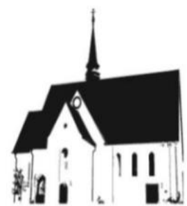
ST. PETER MERNES