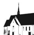
ST. PETER MERNES

E-Mail: sankt-peter-mernes@pfarrei.bistum-fulda.de