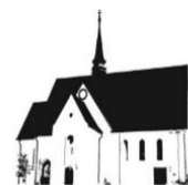
ST. PETER MERNES

Montag und Freitag von 09.30 Uhr – 11.30 Uhr Mühlbachweg 3, 63628 Bad Soden-Salmünster - Mernes ☎ 06660 / 91 94 20 E-Mail: sankt-peter-mernes@pfarrei.bistum-fulda.de