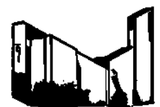
KOSTBARES BLUT BURGJOSS

Pfarrbote auch online auf unserer Internetseite: www.katholische-kirche-jossgrund.de