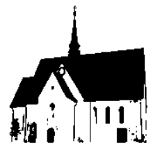
ST. PETER MERNES

E-Mail: sankt-peter-mernes@pfarrei.bistum-fulda.de