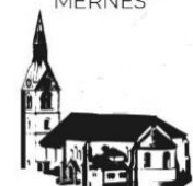
ST. MARTIN OBERNDORF