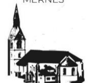
ST. MARTIN OBERNDORF